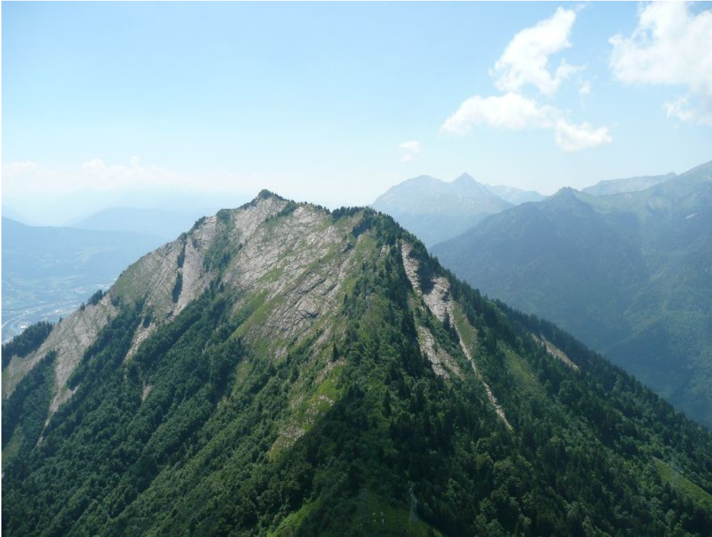
La Belle Etoile, Le Parc du Mouton et enfin la Dent d'Arclusaz