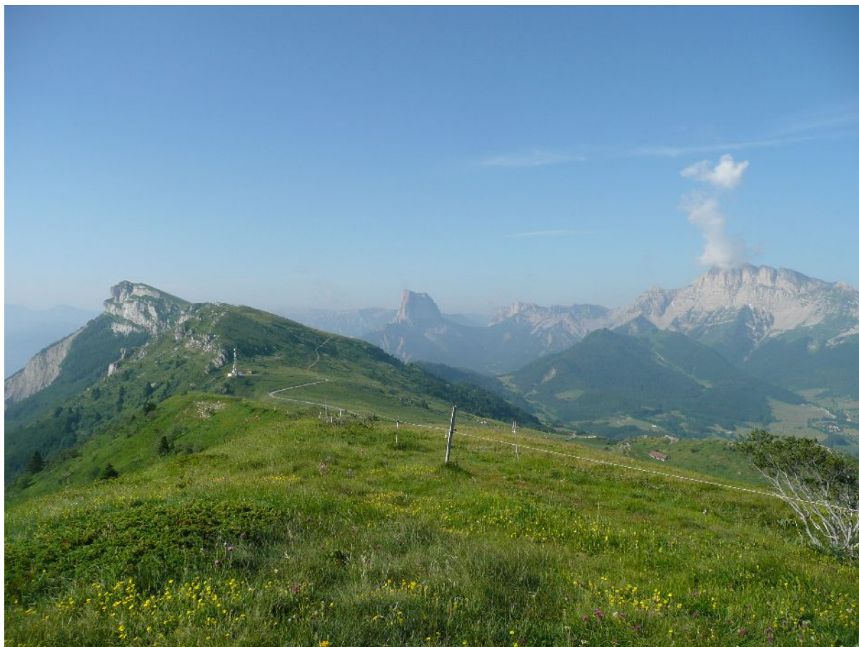
Le décollage du Serpaton

Dimanche 11 juillet, nous arrivons les premiers sur le déco du serpaton. Les conditions ont l'air bonnes, des cumulus se forment sur les crêtes du Vercors et les crosseux arrivent petit à petit.