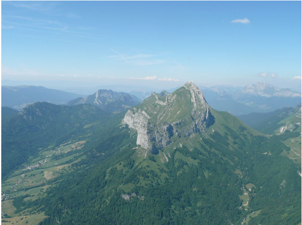
La Dent de Pleuven

J'arrive finalement sur la face ouest de la Dent où je refais le plafond avant de partir sur la Dent de Pleuven.