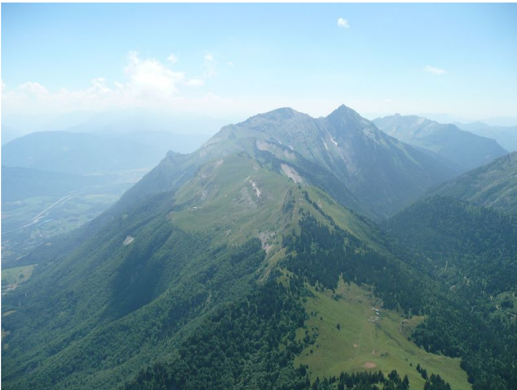
Au dessus du Parc du Mouton en direction de la Dent d'Arclusaz