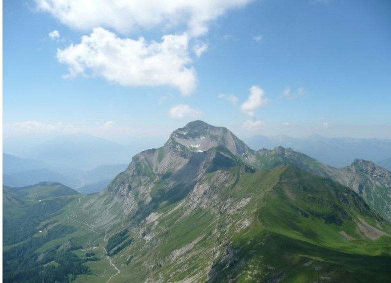
En arrivant au Charvin

Les conditions sont encore meilleures, avec des plafonds plus hauts et des nuages un peu plus discrets.