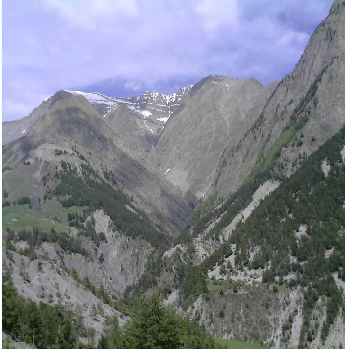
Vue vers l'Estrop depuis Saume Longe